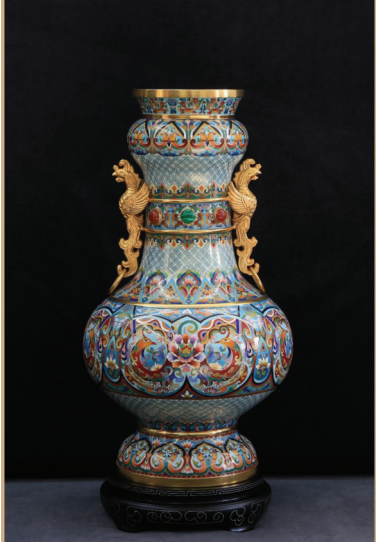
《繁花飞舞》作者:张颖

2015年恰逢联合国成立70周年与世界反法西斯胜利70周年。《和平尊》被选为我国赠送给联合国的国礼,这也是中国景泰蓝与中国匠人第一次“站”在