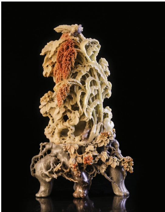
青田石雕作品:《高粱》