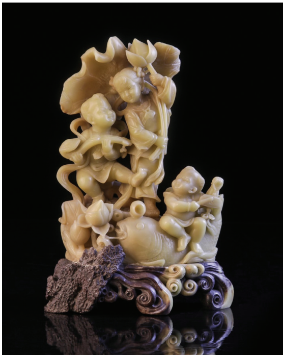
青田石雕作品:《丰收》