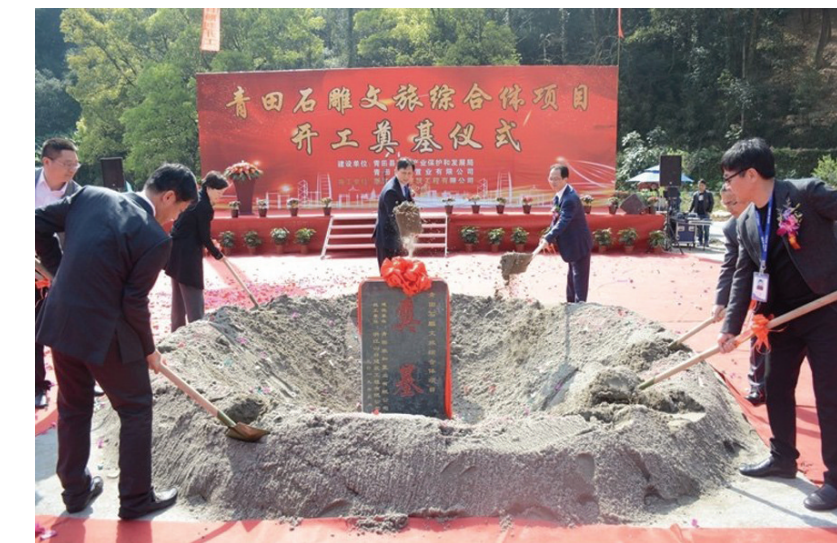
青田石雕文旅综合体项目开工奠基

田县政府就与中国美院签订了《青田石雕校地人才培养战略合作协议》,在石雕人才培养、产品设计开发、教学研究创新、品牌宣传提升、文化使馆建设等方面,开展全方位的深入合作。