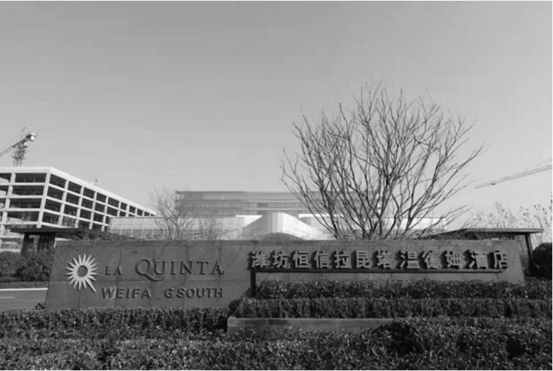
□ 本报记者 桂大成

每个“酒店控”心中,都有个叫“温德姆”的名字。温德姆酒店集团作为酒店行业代表品牌,是全球知名的酒店集团企业,如今已在全球六大洲68个国家经营15个品牌。 秉持“全心为您”的品牌宗旨,承载着无数消费者对度假生活的美好想象。2022年1月8日,恒信拉昆塔温德姆酒店将在山东潍坊正式开业,为国内的消费者提供来自国际化酒店的品质服务。