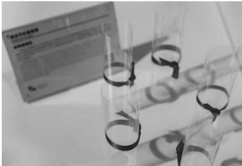
制造业大会展出的柔性可折叠玻璃。