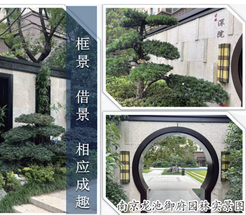
框景 借景 相应成趣

强实测；材料进场严格验收把关；全流程管理留痕。期间，为了保证外立面的平整度和线条造型的顺直度，工程师团队多次上吊篮，用靠杆对每一层立面进行地毯式校验，将每一处不合格点圈出整改。