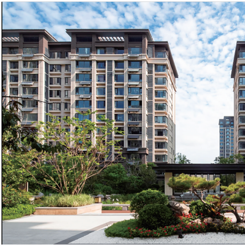
聊城锦绣观邸大区实景

园林中的植物多采用乡土树种，如合欢、国槐等，并在原设计的基础上调整及增加了桉柳、造型太阳李，从而丰富了植物群落的颜色及季相变化，使得整个园林“三季有花、四季有景”。