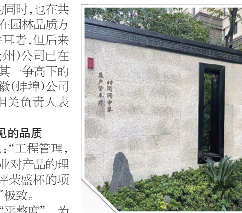
框景 借景 相应成趣

聊城锦绣观邸有这样一份数据统计，详细列举了项目施工过程中，主体阶段、装饰装修阶段各分项目标值和实测值的曲线，实测值均高于目标值。如墙面垂直度目标值为95%，实测值为97%；墙面空鼓目标值为90%，实测值为96%；开间进深目标值为99%，实测做到了100%。