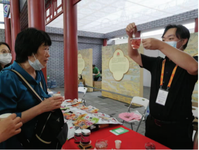
红螺食品展台工作人员向消费者介绍鲜玫瑰花茶的冲泡方法。

9月5日，记者在中国国际服务贸易交易会北京老字号专区看到，不少从1号展馆出来的观众停下脚步后，拐弯