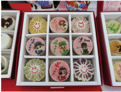
印有京剧脸谱的北京稻香村月饼。

此外，在“帮扶产品区”，可以看到“凝心助帮扶，携手促消费”的理念践行。永辉超市一石景山区消费帮扶、西藏帮扶产品、内蒙古帮扶食品和手工艺品，聚焦巩固拓展脱贫攻坚成果，全面推进乡村振兴，不断深化东西部协作和定点帮扶。正如工作人员介绍，“借助服贸会的平台，扩大支援协作地农特产品的影响力，为在各地消费者带来新产品的同时，也助力帮扶产品走得更远、更好。”