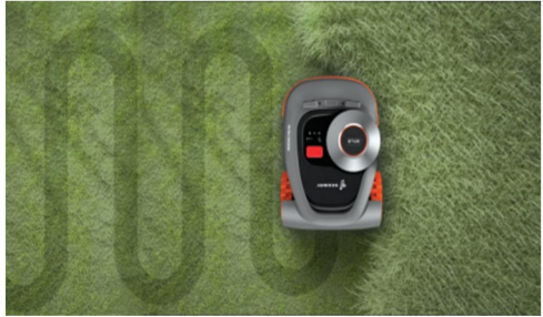
赛格威智能割草机器人在规划式割草

根据统计数据，在美国有草坪家庭，花在草坪维护上的时间平均每次要超过两小时，请人上门维护草坪的单次花费在40-80美元，年支出1000美元以上，在欧洲，由于人力成本高，这个数字则更高。而赛格威智能割草机人直接省去埋