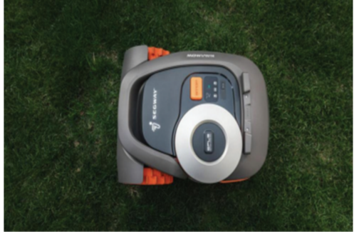
赛格威智能割草机器人

在产品性能方面，作为全球首款超静音无边界智能割草机器人，赛格威智能割草机器人可谓性能卓越。除了能实现精准自主作业以外，还具备低噪音、高频精割、精准避障等多重优势，有望对当前割草机市场带来颠覆性改变。