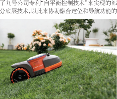
赛格威智能割草机器人爬坡

具体来说，赛格威智能割草机器人以九号公司的技术作为底层支撑，创新性地推出一系列软硬件结合技术，比如在电机和控制系统的设计上，它沿袭了九号公司对户外场景的理解，沿用了九号公司专利“自平衡控制技术”来实现的部分底层技术，以此来协助融合定位和导航功能的