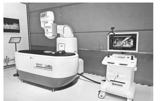
重庆金山公司出口到俄罗斯的全自动导航胶囊机器人

蒙古国展区除展示蒙古国的旅游、文化等,还重点展示了蒙古国首都乌兰巴托的信息化建设有关情况,以及蒙古企业、高校等开发的求职软件、网上预约软件等便民服务App。