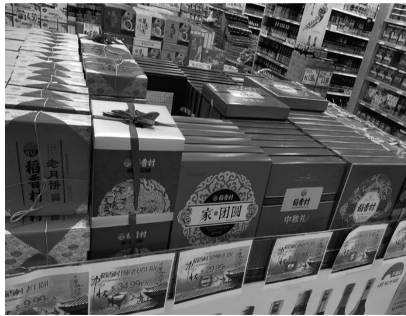
苏州稻香村月饼在海外上架