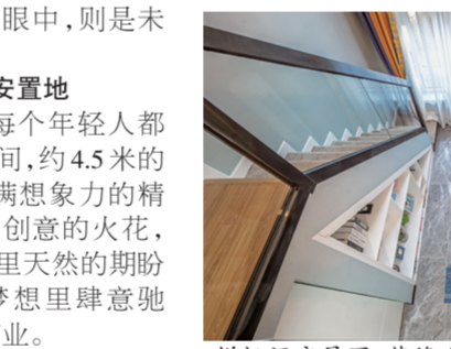
样板间实景图 装修公司效果示意 非交付标准

随着经济的快速发展以及人民生活水平的不断提高服用阿胶来滋补养生,成为备受认可的健康生活理念,俨然已是新的时代潮流,受到越来越多人的青睐,鱼龙混珠的现象也屡见不鲜。大批的劣质、低价产品蜂拥而至,市场上部分阿胶产品质量参差不齐,以假乱真,鱼龙混珠的现象也屡见不鲜。山东鲜炖阿胶公司基于解决消费者的痛点,一是解决让消费者吃阿胶吃的更方便,二是让消费者吃阿胶吃的更放心,三是让消费者吃阿胶吃的新鲜又有营养。