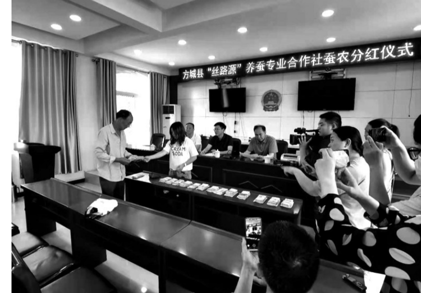
桑蚕养殖蚕农分红

部书记3人，全镇38个村两委班子健全；发展党员20名，培养村两委后备人员120人。实施头雁工程，全镇有36名村两委主要成员从事林果、香菇种植、桑蚕养殖，带动200多人规模种植。三是建强基层阵地。基层阵地是建强基层组织的根本。按照“标准一流、设计科学、资源整合、一村一品、开放管理”要求，实现38个村党建阵地全覆盖。四是筑巢引凤创大业。人才是建强基层组织的主要力量。建立四里店镇在