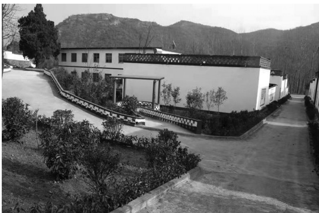
四里店镇美丽乡村一角

深入推进农业供给侧改革，加大产业发展，推进产业链、价值链双链运行，推动农业高质量发展，实现产业振兴；强化人才支撑，建立乡村振兴人才库，营造良好创业环境，鼓励在外成功人士和外出能人返乡创业，实现人才振兴；持续挖掘“知青文化”“王维文化”等，加大青年农民诗人景淑贞的推介力度，打造乡土文化品牌，实现文化振兴；坚持“两山”理论，以农村人居环境整治为重点，扎实开展农村垃圾、污水、厕所“三大革命”，打造农民安居乐业的美丽家园，实现生态振兴；始终坚持党建引领示范统揽乡村振兴全局，建立健全党委领导、政府负责、社会协同、公众参与、法治保障的现代乡村社会治理体制，实现组织振兴。