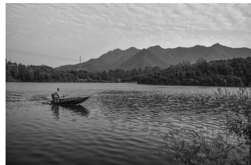
四里店镇湾潭景区

标，创新脱贫攻坚组织体系和活动方式，在“林果桑药菌游”六字上狠下功夫，大力推进本镇香菇、桑蚕、黄金梨、白桃、葡萄、果桑、苗圃、中草药等特色种养业发展。