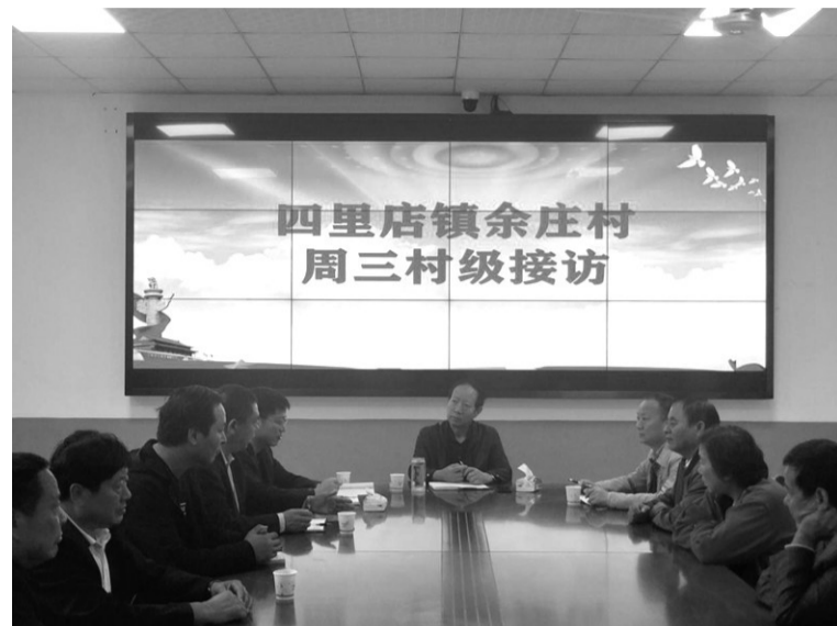
创新信访调解机制——周三村级接访