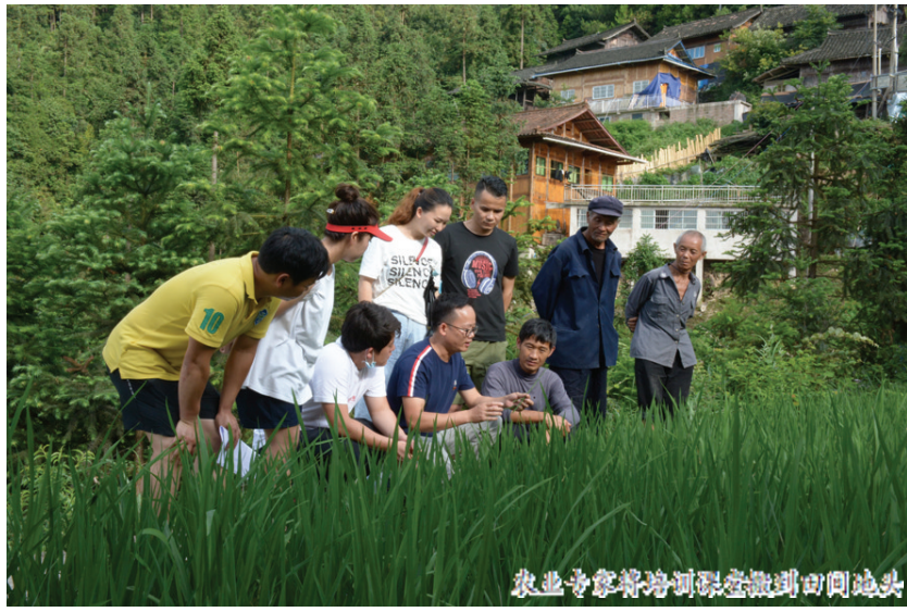
农业专家指导田间地头

目标,撸起袖子精准施策,下绣花功夫扎实推进,出台《“十三五”抓党建促脱贫攻坚工作规划》,创新开展“十户一体”抱团发展模式,探索总结抓党建促脱贫“十攻略”,通过请进来、送出去打造一支带不走的人才队伍,在探索党建扶贫和高效衔接乡村振兴道路上迈出坚实步伐。