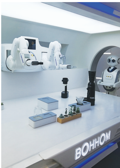
博众精工研发的机器人

态绿色高质量发展,展示跨界跨省融合创新,引领世界级水乡人居典范,将长三角生态绿色一体化发展示范先行启动区打造成生态绿色发展的功能样板。在经济界人士看来,凭借区位和生态优势,“江南水乡客厅”是长三角经济圈不可忽视的“潜力股”,将成为引领示范区消费新增长极的典范。