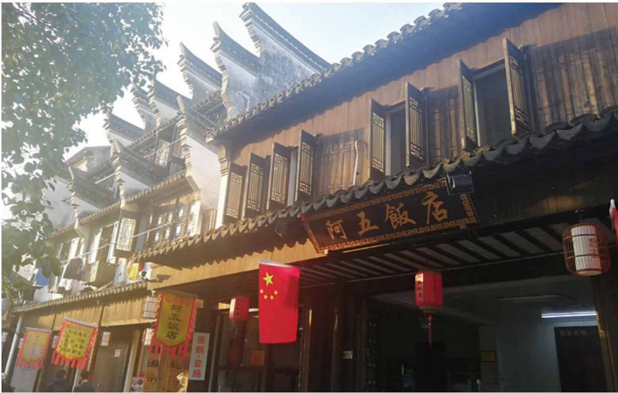
吴江市黎里古镇一角

■作为沪苏两地协作共建的第一个跨省级道路互联互通重大民生工程项目,康力大道的建成通车,开启了省际连接通道建设的新模式。