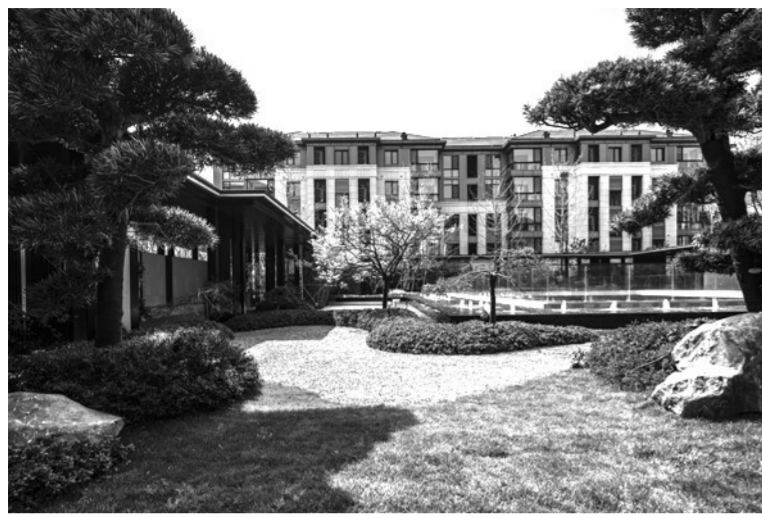
□ 本报记者 徐建军

滔滔黄河，巍巍嵩山。在大河的南岸，在嵩山的脚下，一座新兴的历史名城郑州如晨曦的太阳正在冉冉升起。伴随着郑州的崛起，创立于郑州、生长于郑州、发展于郑州、壮大于郑州、成功于郑州的正商集团也被世人所知、所传颂。是郑州的崛起造就了正商集团，同样，正商集团全体员工上下一心的努力也书写了郑州发展史的辉煌篇章。