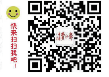
消费日报微信公众平台