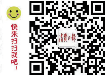
消费日报微信公众平台