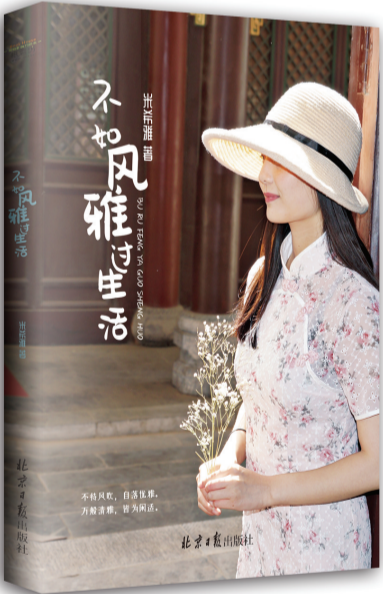
作者米希雅即将上市的新书