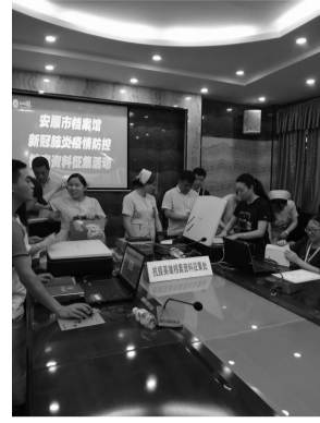
档案部门在302医院组织开展战役档案现场征集