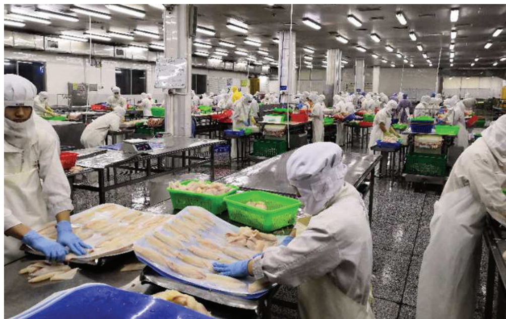
繁忙的罗非鱼生产加工车间一角

“只要思想不滑坡,办法总比困难多。”面对各种挑战,公司想方设法开拓新的国外市场,俄罗斯、加拿大、中