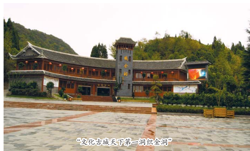
“文化古城天下第一洞织金洞”

在对织金古建筑、古驿道进行修缮保护工作时，县政府还积极探索文物保护工作的创新思路，努力把围墙式的消极保护逐步转变为开放式的积极保护，在保护中谋发展，进一步作好规划，通过对文物的保护和修缮，达到开发利用的目的，同时为老百姓提供一个休闲娱乐