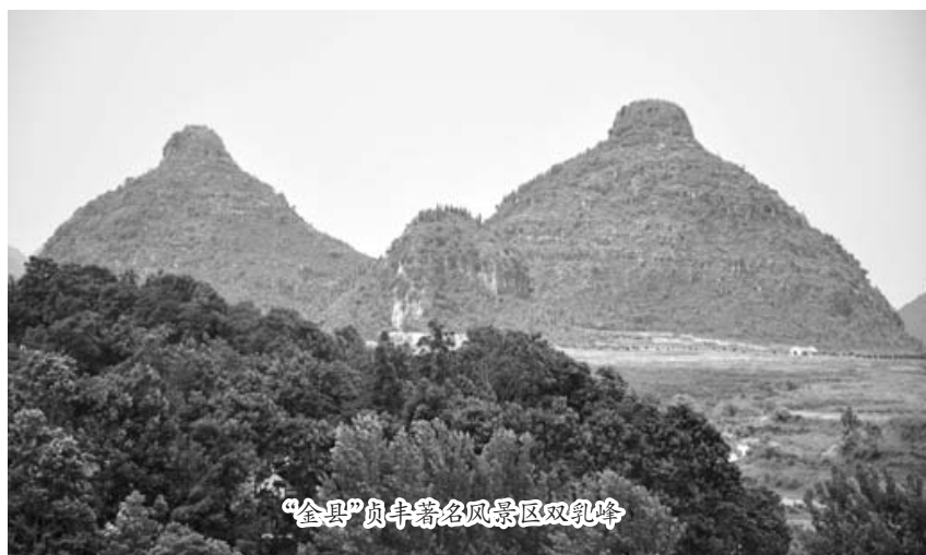
“金县”贞丰著名风景区双乳峰

在贵州布依族文化节中,“六月六”可以说是布依族人民“过小年”的隆重节日,当天人们身着布依族盛装相聚在一起,进行祭祀、对山歌等民俗活动。为挖掘传承优秀布依族传统文化,贵州省黔西南布依族最为聚集的贞丰县从 2003 年起连续举办“六月六”盛大活动,展示当地布依族独特风采,发展民族文化旅游产业。