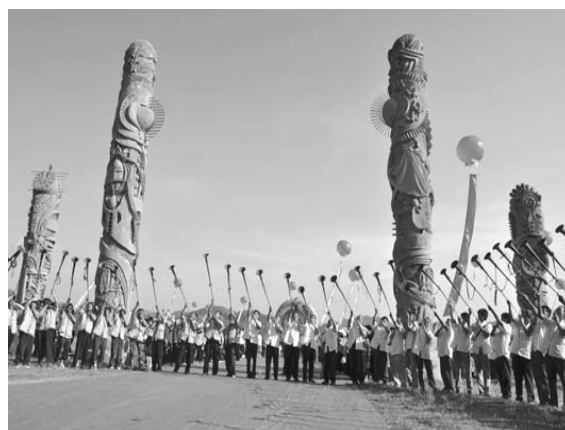
“金县”贞丰各族人民载歌载舞喜迎“六月六”布依族风情节

本报讯 1 月 6 日,秉承经典美国文化的 T.G.I. Friday's 首家新概念餐厅于北京 CBD 区域世界城揭幕。全新升级的 Friday's 为中国消费者提供更健康,更欢乐,更丰富的用餐体验。