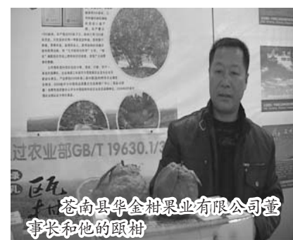
苍南县华金柑果业有限公司董事长和他的瓯柑

浙江省苍南县华金柑果业有限公司自 2002 年以来在温州市苍南县巴曹镇相继发展种植瓯柑基地 3 个,面积 1000 多亩;在平阳县维新乡种植瓯柑、雪梨 500 多亩。苍南县华金柑果业有限公司现已拥有资产 1000 多万元,各种殊荣满钵满盈:2005 至 2009 年连续五年被评为苍南县农业龙头企业,2010 年被评为温州市“百龙工程”农业龙头企业,2010 年被全国合作经济产业化委员会评为瓯柑产业示范基地;2006 年,该公司生产的绿乳牌瓯柑参加第二届(温州)特色农业博览会荣获银奖,并被授予“中国绿色科技农业名优品牌”,2008 年参加第三届(温州)特色农业博览会荣获金奖,2008 年被农业部中绿华夏有机食品认证中心 GB/T19630.1/3/4 认证为有机食品,2009 年参加浙江省农博会荣获优秀奖,2009 年参加第十六届中国(杨凌)“农高会”荣获“后援”奖,2009 年参加 CCTV.COM(央视网)食品频道“全国优秀食品安全品牌