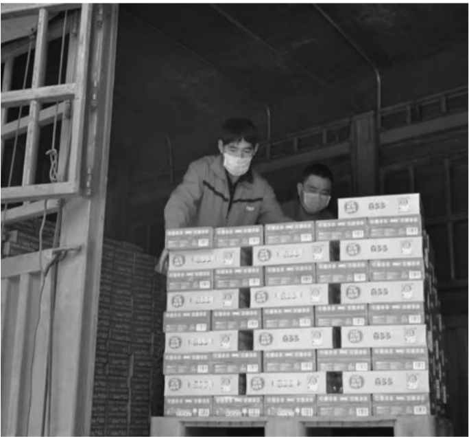
援助最前线 罐头企业纷纷行动

1月31日,搭载着山东潍坊诸城一家食品企业爱心的货车,紧急驰援武汉防疫工作一线。2月2日,由喜多多集团追加捐赠的第三批物资3000件产品分批运抵武汉。类似的消息正在不断更新着。春节前一个月,正是回乡游子规划着路线、计算着时间,准备着节礼的时候。热闹喜庆的节日氛围早已在快消品行业展露无疑,各个生产企业都马力全开地为备战。但随着新型冠状病毒肺炎的出现,一场没有硝烟的“战”悄然打响。在湖北武汉的逆行者背后,一批批企业也在竭力贡献着自己的力量,保障前线人员的饮食需求。面对突如其来的疫情,作为应急食品的罐头也加入“战”后备力量,为前线人员“筑”营养、解“乡”思。