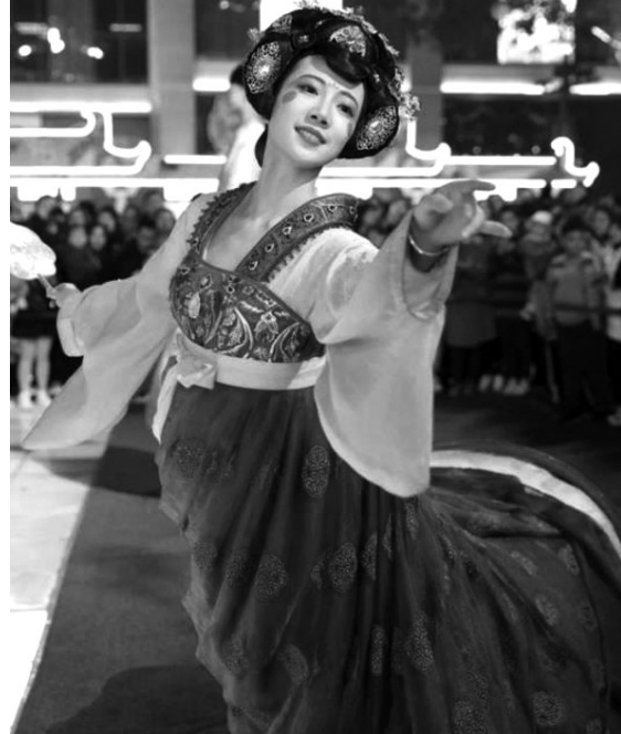
一位表演者带火一条商业街

最近,大唐不夜城成为了不少消费者前往西安旅游的一个新打卡景点。百度指数显示,大唐不夜城在手机和PC端的搜索量,近30天内同比上涨1158%,11月的搜索量达到了有史以来的最高值。