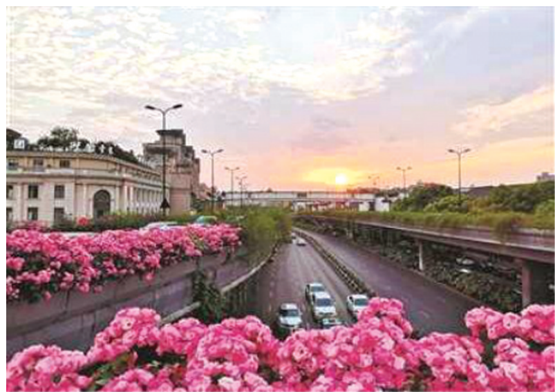
杭州城市高架上鲜花争艳

2017年,杭州住建部授予“国家生态园林城市”,成为全国副省级城市中唯一获得该称号的城市,而全国获此