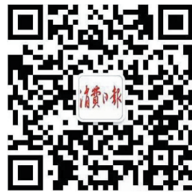
消费日报微信公众平台